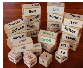
Erweiterungspaket nicht nur für Klassen 1 und 2